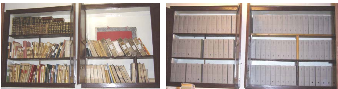
Aspecte de l'AHPB abans del tractament arxivístic (esquerra) i aspecte actual (dreta).

El fons d'arxiu parroquial que es custodiava originàriament en un armari situat en el despatx de la rectoria, ocupava aproximadament 5 metres lineals de prestatgeria. La nova instal·lació, fruit de l'actuació arxivística, inclou nou material d'arxiu de conservació amb reserva alcalina (arxivadors, carpetes i cobertes) i una disposició folgada, d'acord amb els principis de conservació.