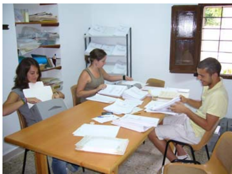
Arxivament de la documentació

Una vegada finalitzada la primera etapa de classificació, descripció i instal·lació dels fons documentals de l'AHPB, s'inicia la Fase 2 que financia totalment l'Ajuntament de Begues, que té per objectiu la digitalització de 30.000 cares documentals. Durant la redacció d'aquesta ponència s'està portant a terme la preparació i digitalització de tots els documents de l'AHPB. Finalitzada la digitalització el CEB disposarà de dues còpies màster de conservació de 300 dpi i dues còpies de consulta de 150 dpi. Es lliuraran amb dos discs compactes externs i dos conjunts de DVD. La digitalització de l'AHPB farà possible un accés a la documentació molt més àgil, i permetrà una menor manipulació dels documents, afavorint una millor conservació de la documentació.