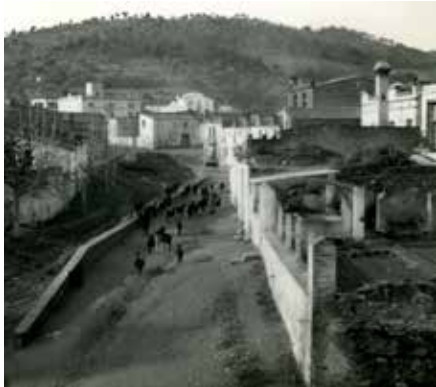
Carrer de La Riera des de Cal Galan, als anys 1950.