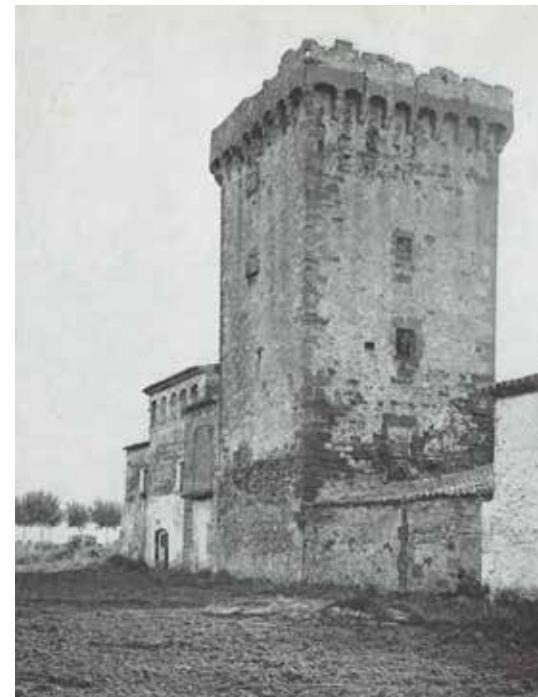
Torre de Climent Savall. S'observa en la seva base, sobretot a les cantonades, l'ús de pedres calcàries, que tal vegada siguin un vestigi d'una torre anterior a l'actual.

Les mateixes, com sí que va passar a Gavà, no van haver de servir com a centres d'unitats jurisdiccionals de cap mena, sinó merament defenses dels seus propietaris o punts de control aixecats pel senyor de Castelldefels o de l'Eramprunyà.