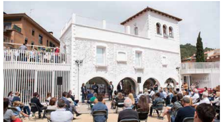
Inauguració de la biblioteca de Ca l'Altisent.

Tot i la construcció d'un gran casal com cal Fuster, lligat a la masia de can Mas en el segle XVIII, aquest carrer poc urbanitzat i sotmès a les inclemències naturals de les rierades, va viure en un segon pla de la vila fins als anys 20 del segle passat, quan es va enderrocar la casa de cal Burro que estava situada entre la Plaça, el carrer Major, cal Marí i cal Fuster i va obrir-se el poble a costat de Mestral, on ja hi havien aparegut, també, el carrer de Nou de Sant Climent i el carrer del Mig. El pas de la casa de la Vila des de la Plaça a cal Marí i la construcció del Pont sobre la riera de les Comes van ser passos fonamentals per a l'evolució del carrer de la Riera que va passar de ser una camí de cabres (literalment dins la llera de la riera) al centre de referència de la població en el segle XX i en el XXI, amb l'obertura de la biblioteca de ca l'Altisent i la urbanització i enjardinament del Torrent de Santa Cecília.