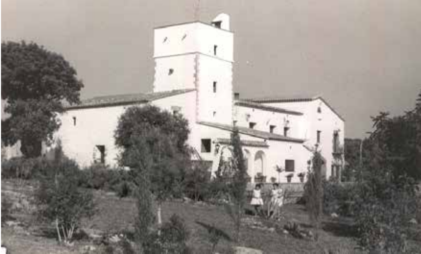
Masia de Can Vinyes.

Castelldefels: una ciutat de torres de vigilància i de defensa ja en els segles XIV i XV?