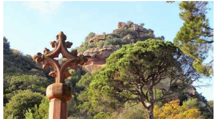
Castell d'Eramprunyà des del Brugués.

demanant la consolidació urgent dels elements més fràgils. Posteriorment, a partir de les reunions conjuntes i visites in situ dutes a terme, s'ha començat a treballar en la redacció d'un projecte per a determinar quines actuacions de recuperació i consolidació són prioritàries i com s'han de dur a terme. També s'està valorant quins d'aquests elements es poden integrar a la xarxa de camins d'ús públic i als itineraris guiats del castell.