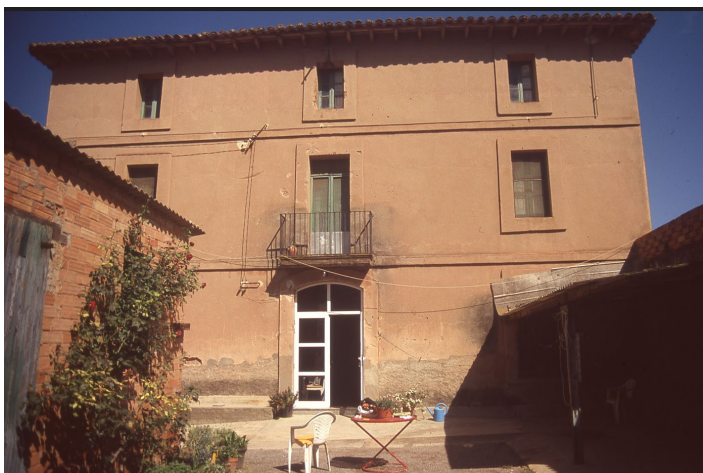
Façana amb balcó (any 2004)

Ja que es fa una intervenció general de la finca i l'edifici convindria resoldre de forma adequada les gaies d'espais perimetral exteriors a la tanca i que dona als vials situats al sud i a ponent. Actualment hi ha zones atalussades que no dignifiquen la finca.