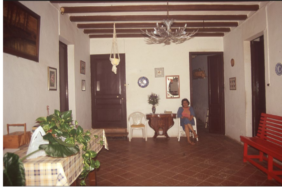
Sala del primer pis il·luminada pel balcó (any 2004)