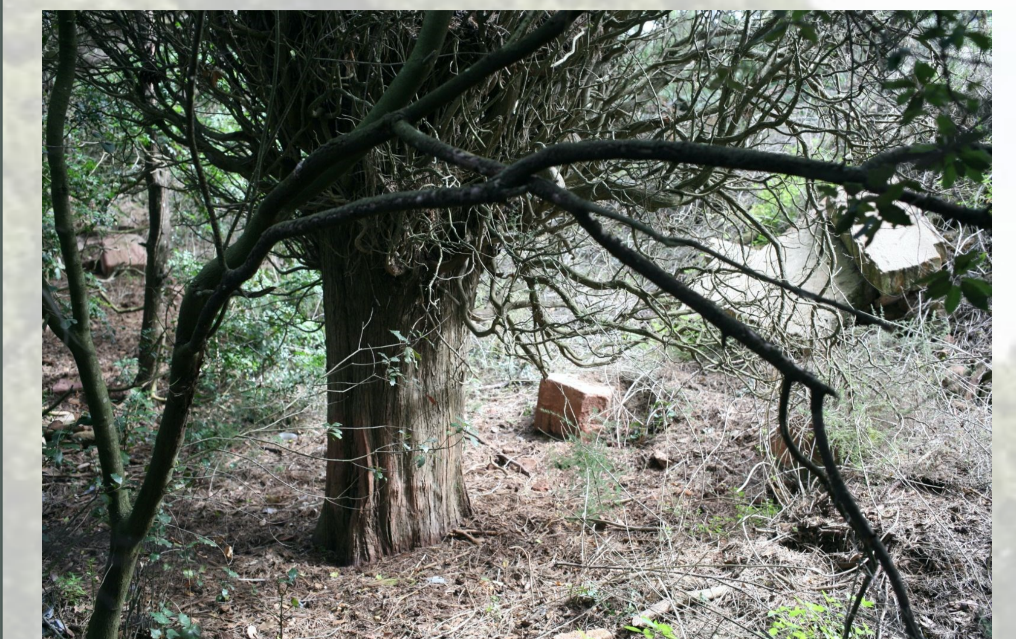
Vista actual de detall d'un dels xiprers de l'antic cementiri.

El nom botànic del xiprer és Cupressus sempervirens . És una conífera de fulla permanent. Aquest nom vol dir sempre viva, que està relacionat amb la seva longevitat. És un arbre que pot durar tres-cents anys. Esperem que els nostres hi puguin arribar, també. Els avantpassats que els varen plantar i cuidar fins que es van poder valdre per si sols, també ho devien fer amb la mateixa intenció.