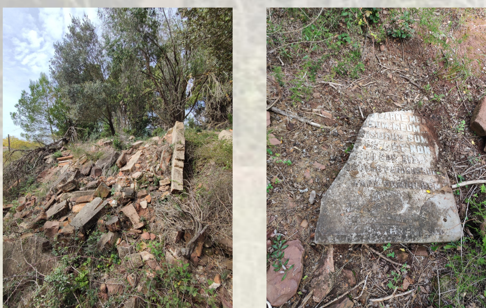
Vista de detall de les restes enrunades i fragments de lapida que encara resten on era el cementiri.

Un cop fet el trasllat de les restes humanes el 1966 es decideix a enderrocar els nínxols i parets de l'antic cementiri. Segons l'expedient conservat a l'arxiu municipal l'enderroc va tenir un cost d'unes 15.500 pessetes de l'època. Un cop enderrocat, l'any 1967 s'autoritza a un veí de Begues poder utilitzar les pedres del cementiri per altres usos. Així i tot, encara avui queden restes dels nínxols i murs d'aquest antic cementiri.