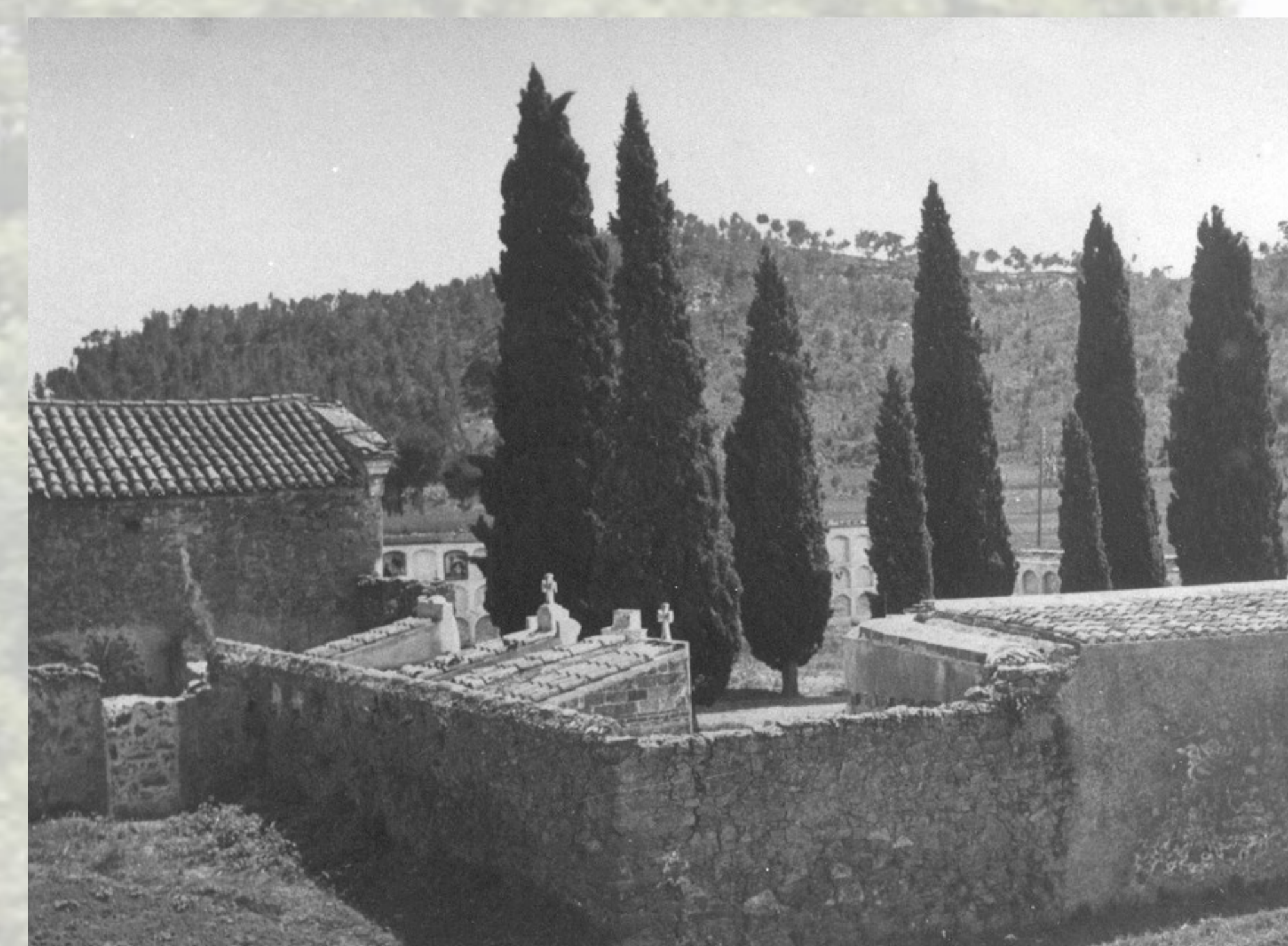
Vista de l'antic cementiri situat a la Collada, amb el passadís de joves xiprers al centre.

Però dos anys de males collites, 1866 i 1867, impedeixen tirar endavant el projecte de construcció del nou cementiri per la falta de fons a les arques municipals, i no és fins al 1868 que es reprèn el projecte i s'inicien les obres el 28 d'abril de 1868, treballs de construcció que es van poder dur a terme gràcies a la participació de jornalers que estaven sense feina.