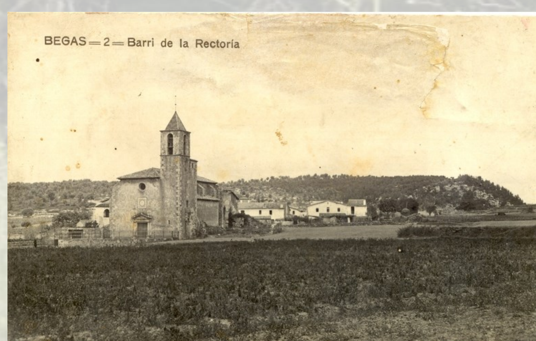
Vista de l'antiga església on es poden veure restes de l'antic mur de tancament del cementiri que hi havia adossat al temple fins al seu trasllat al segle XIX.